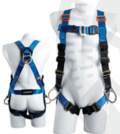
4 Argollas en H