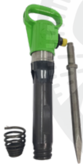
MARTILLO PICADOR G10