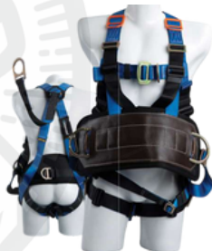
Arnes para encuellar