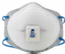
Serie 8000 Cup