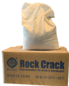
CEMENTO O MORTERO EXPANSIVO