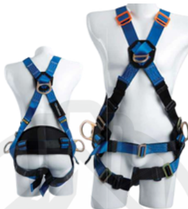
4 Argollas cruzado