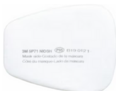
Filtro de partículas 3M™