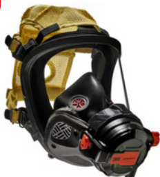
Máscara 3M™ Scott™ Vision C5