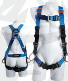
3 Argollas en H