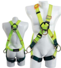
4 argolla con mariposa Fro