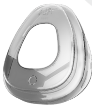
AIR RPF1 RETENEDOR