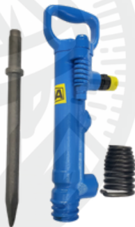
MARTILLO PICADOR G7