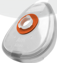
AIR A200 ADAPTADOR