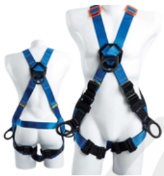
4 Argollas cruzado dieléctrico