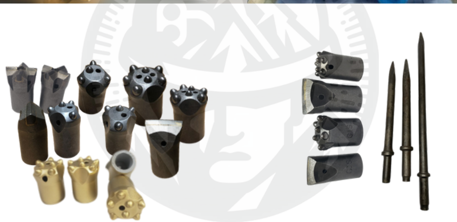
BROCAS PARA BARRENAS DE PERFORACIÓN