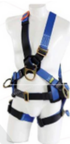
Cruzado 4 argollas con fajas